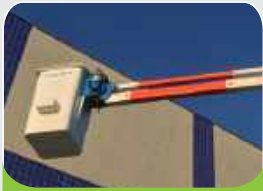
BARRA DE NIVELACIÓN

Sistema de nivelación de la barquilla sin la utilización de cadenas, reduce considerablemente el coste de manutención.