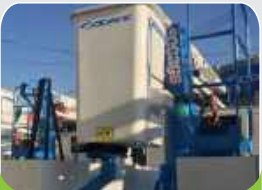
ACCESO A LA BARQUILLA

Equipo compacto y liviano, mejora la estabilidad del vehículo, baja el centro de gravedad y mejora los accesos en calles estrechas.